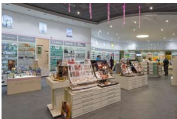
Rogenmoser Apotheke St. Margareten

In der Realisierungsphase lassen wir Ihre Vision von einer neuen Apothekengestaltung Wirklichkeit werden – mit allen Fachplanern und Gewerken, die dafür erforderlich sind. Wir erstellen für Sie die Ausführungsplanung, bemustern Material- und Lichtkonzepte – immer mit dem Ziel, Ihnen eine umsatzfördernde und verkaufsaktive Raumgestaltung zu erschaffen.