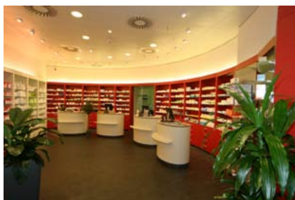
MediPlaza Apotheke Berlin

Wir planen die Kosten und Zeiten der gesamten Baumaßnahmen und haben dabei Ihr Budget immer im Blick. Und selbstverständlich sorgen wir dafür, dass die Arbeiten Hand in Hand gehen, bis zur endgültigen Abnahme.